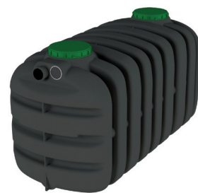
EPURBLOC 119 3000