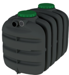
EPURBLOC 119 2000