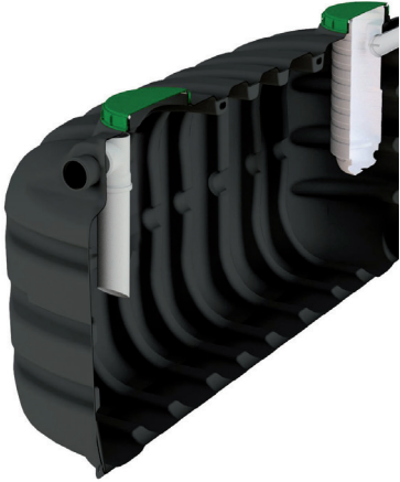
EPURBLOC 119 3000

Fosa Estanca de Acumulación: Depósitos enterrados que únicamente disponen de una conexión de entrada.