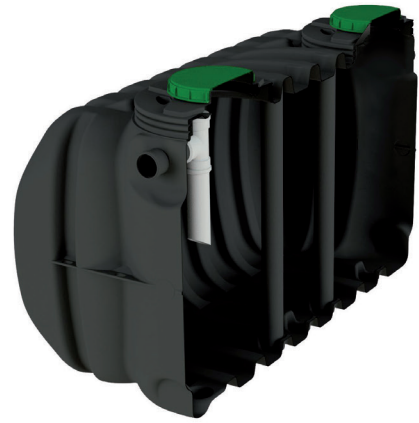
FOSA ESTANCA DE ACUMULACIÓN 185 5000