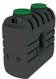
EPURBLOC 77 1500