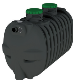
EPURBLOC 122 3000 Con realces REHC 400 (en opción)