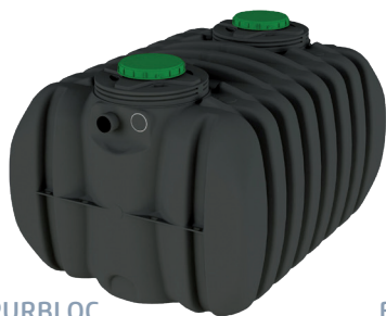
EPURBLOC 185 5000