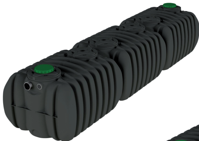
EPURBLOC 185 15000