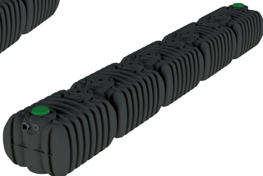
EPURBLOC 185 25000