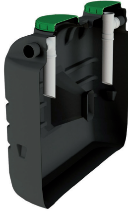
FOSA SÉPTICA 77 1500