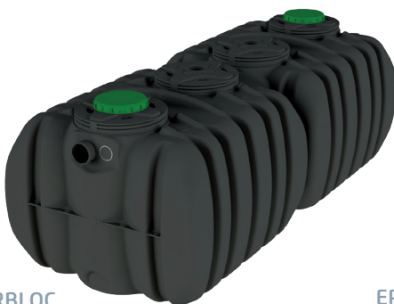
EPURBLOC 185 8000