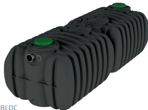
EPURBLOC 185 10000