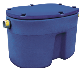
SEPARADOR DE GRASAS BAJO FREGADERO