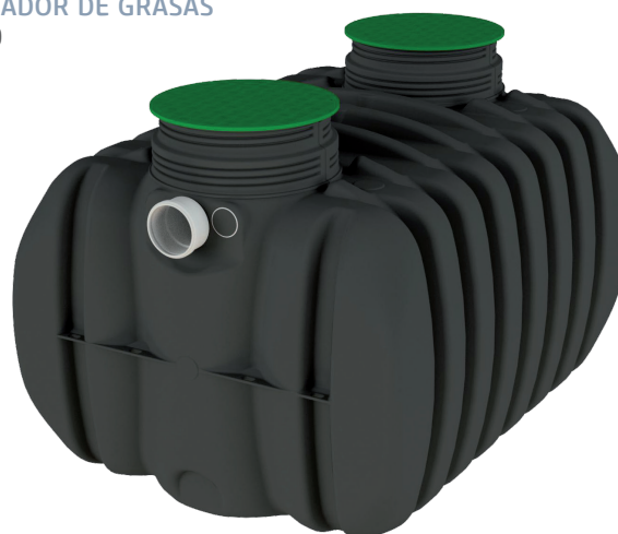
SEPARADOR DE GRASAS 185 5000